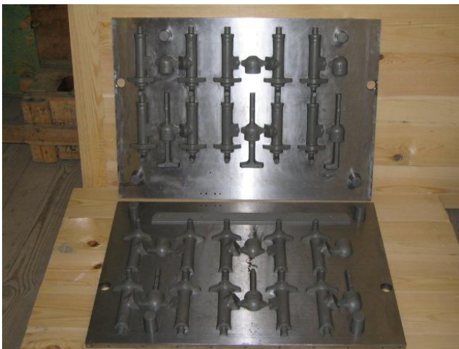
Оснастка для кузовных деталей