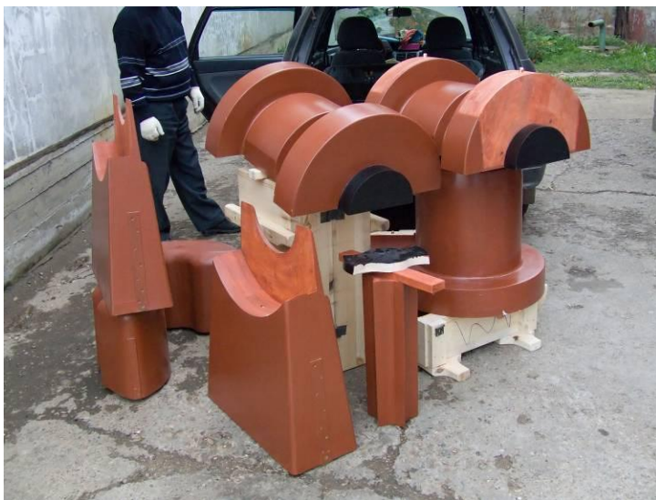
Оснастка из модельных пластиков