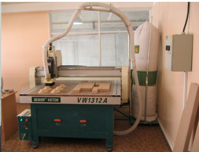
Модельная оснастка из дерева: