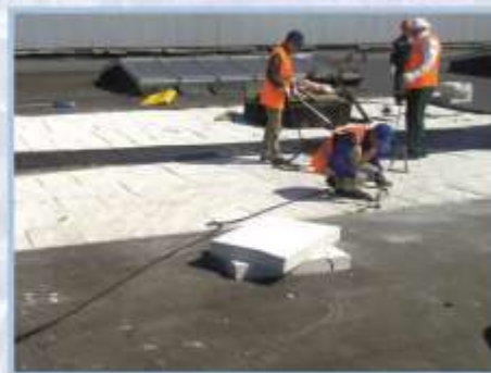
Устройство кровли и зенитных фонарей