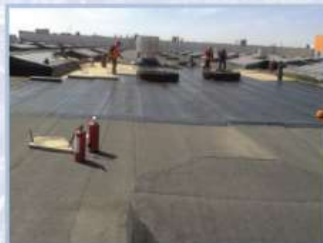
Устройство кровли и зенитных фонарей